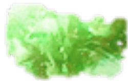
Gélules Fertilisant Hydro-Rétenteur BARBARY PLANTE G3