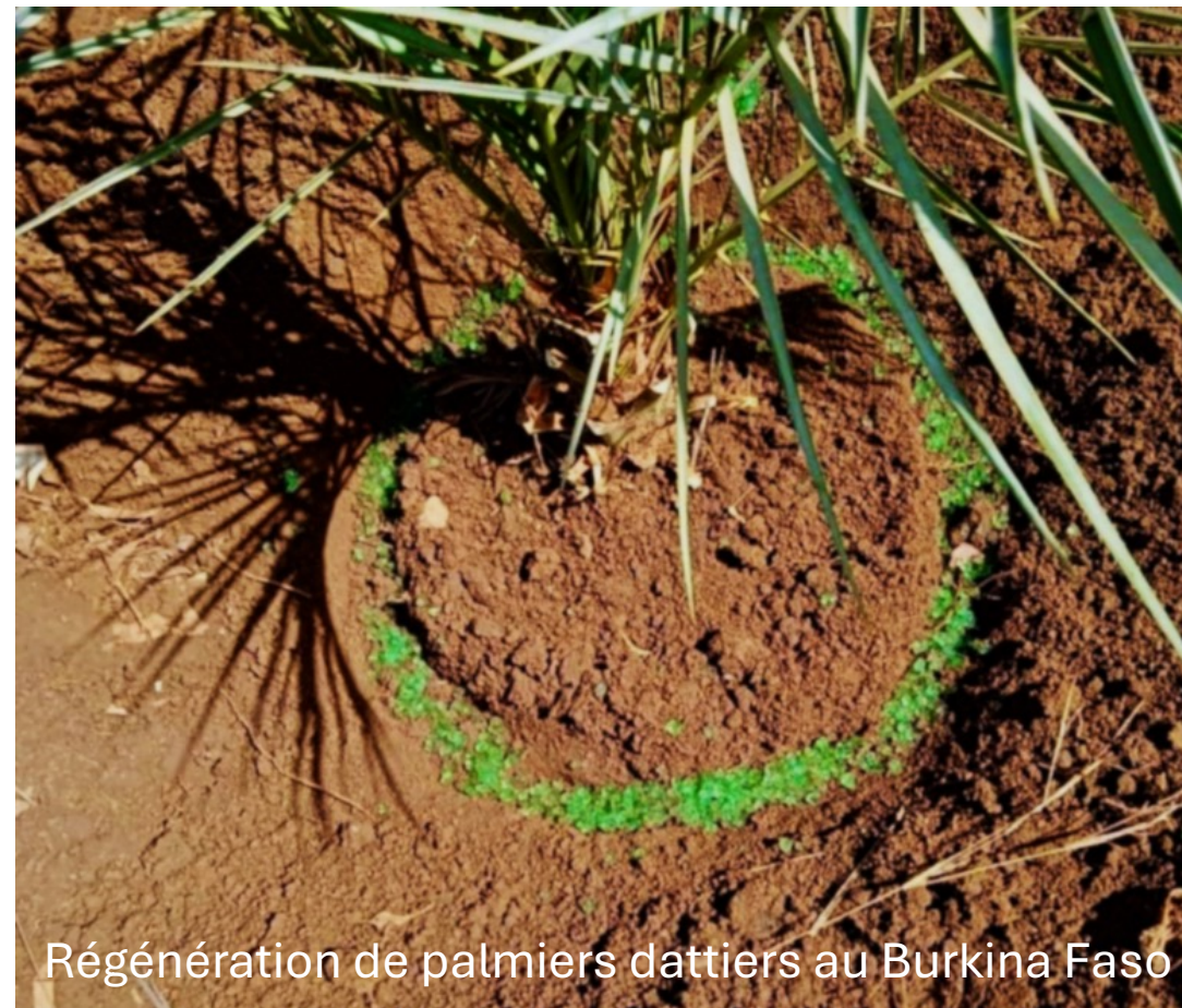
Régénération de palmiers dattiers au Burkina Faso

Cette approche vise à enrichir le sol autour des arbres fruitiers, facilitant ainsi la régénération des arbres affectés par des maladies.